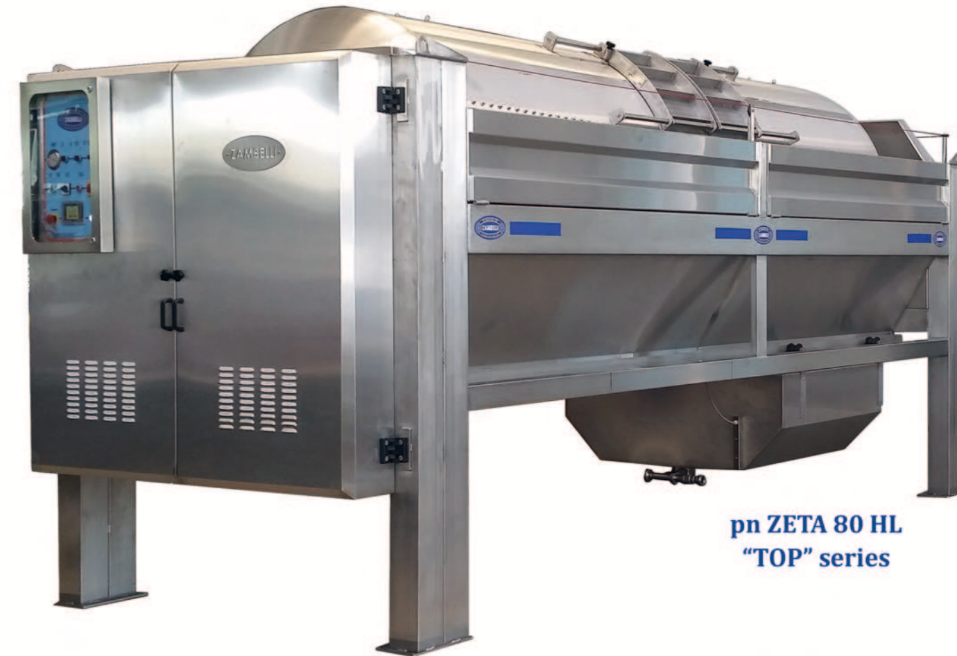
pn ZETA 80 HL "TOP" series