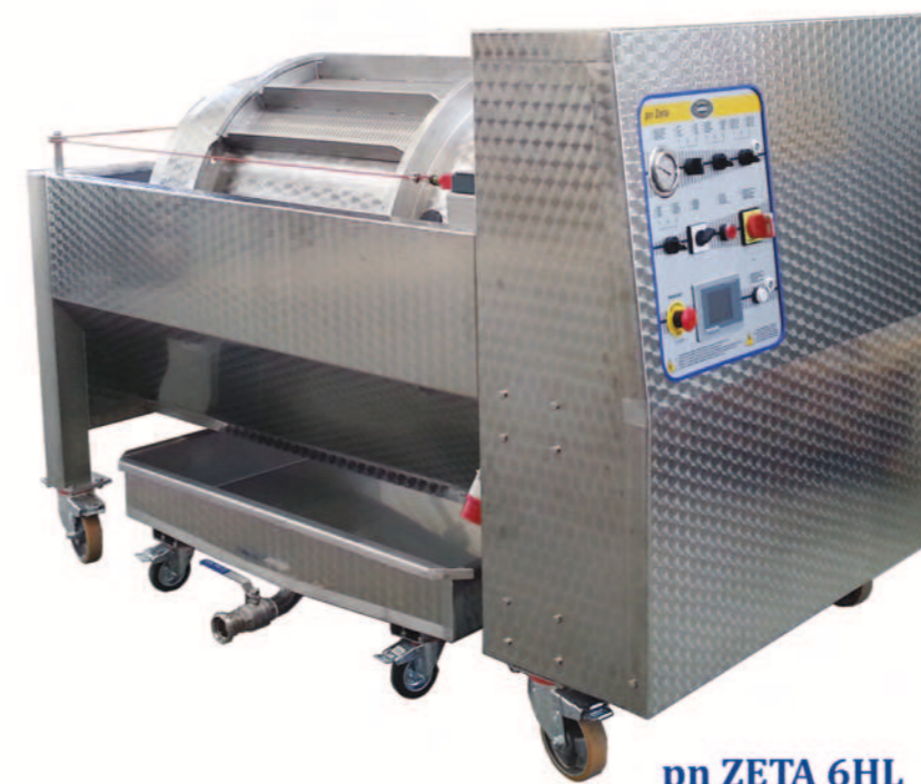
pn ZETA 6HL

La tecnología y experiencia profesional para la ayuda del cliente