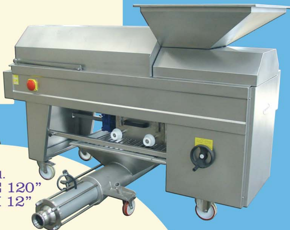
Mod. “EMME 120” & “PM 12”