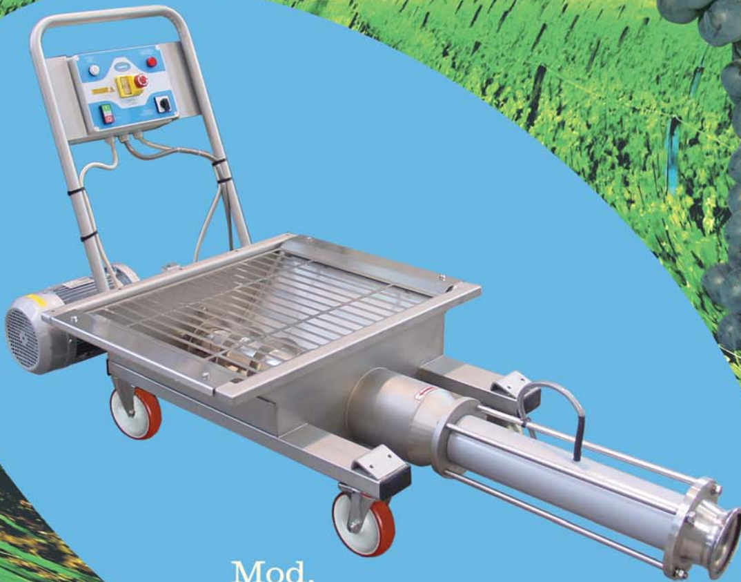
Mod. PM 12

Le pompe monovite serie “PM” sono interamente costruite in acciaio inox Aisi 304 : sono adatte per il trasporto di uva intera, diraspata, pigiata, vinacce fermentate, mosto e prodotti alimentari vari.